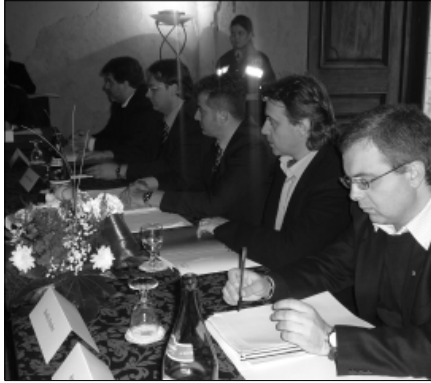
I consiglieri comunali di opposizione